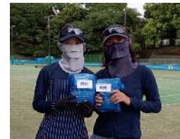
優勝 矢野・夏組 (team WEST)