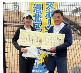
準優勝 鷺山・枝松組(teamWEST)